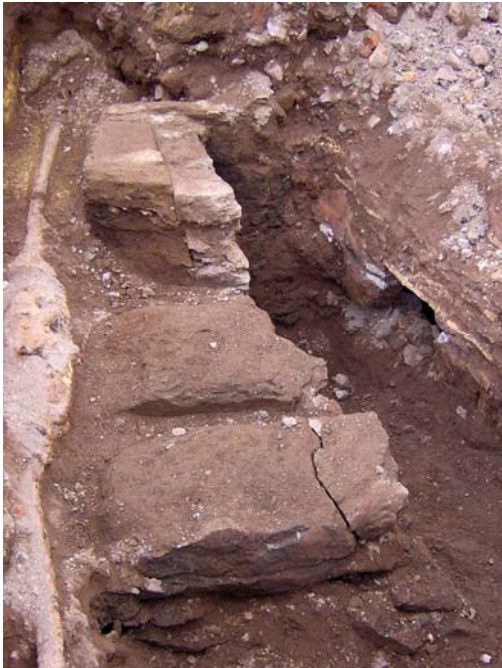
Fig. 2. La cava a cielo aperto.