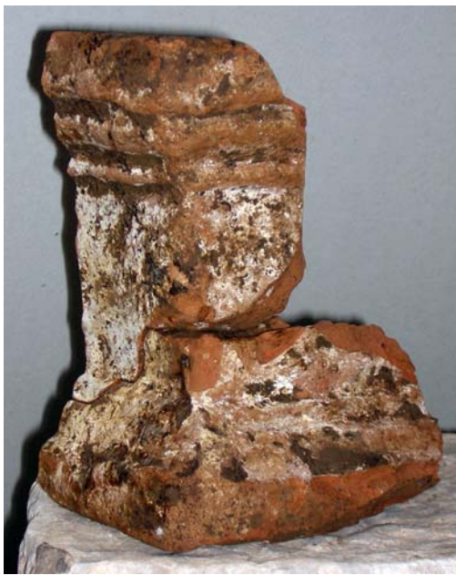
Fig. 3. L'arula fittile parzialmente ricostruita.

anfore Late Roman Amphoras 2 di produzione egea e Keay LII per il vino bruzio) che ne circoscrive il terminus post quem agli anni 440/450-500/525 d.C. (scodella Hayes 84) 7 , restituisce una placca d'osso decorata a linee incise e "occhi di dado" da accessorio di toilette o coperchio di cofanetto ligneo 8 e due frustoli epigrafici, uno dei quali recante parte di formula calendariale.