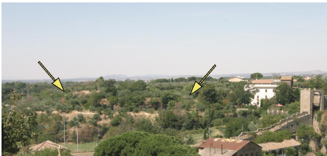
Fig. 4. con indicazione delle evidenze.