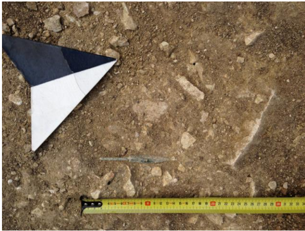
Fig. 21. Monte Adranone. Necropoli. Punta di freccia nel riempimento della Tomba 1/14.