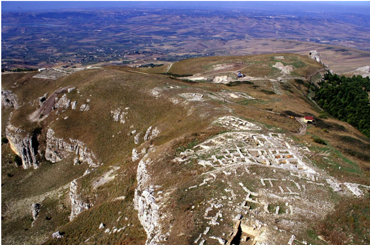
Fig. 1. Monte Adranone (Sambuca di Sicilia). Panoramica.