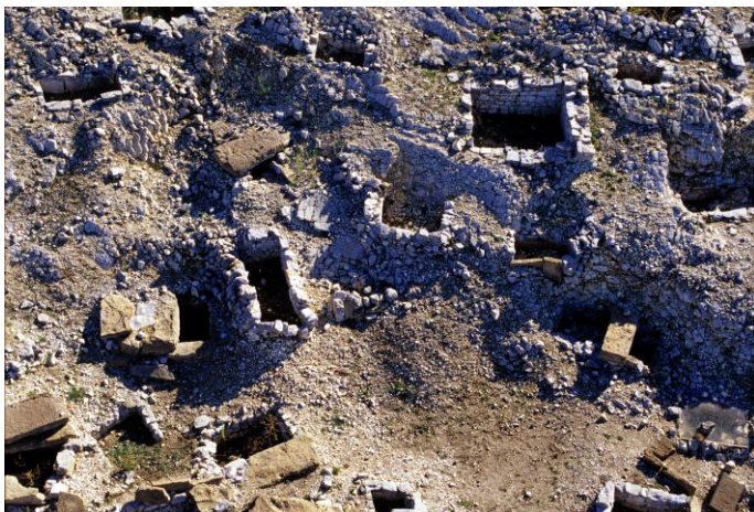
Fig. 5. Monte Adranone. Necropoli. Le tombe del IV secolo.