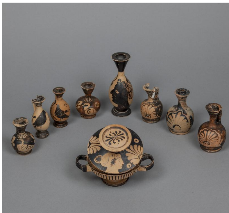
Fig. 30. Museo Archeologico di Palazzo Panitteri di Sambuca di Sicilia. Dal corredo della Tomba XXXIV di Monte Adranone (da TROMBI 2015).

Malgrado siano stati messi in luce settori cospicui dell'abitato antico, la città che visse sul Monte Adranone conserva ancora gelosamente molti dei suoi segreti. Anche le brevi indagini qui illustrate lasciano aperte numerose questioni, che solo la pubblicazione definitiva dei dati stratigrafici della vasta area cimiteriale potrà contribuire a spiegare, a partire dall'organizzazione dello spazio funerario, in relazione all'impianto urbanistico generale. Secondo l'interpretazione comunemente accettata Monte Adranone, centro ellenizzato in età arcaica ricadente nel territorio sotto l'egemonia selinuntina, sarebbe divenuto nel IV secolo uno dei siti di altura sorti o ripopolati nella Sicilia occidentale, capisaldi fortificati di un sistema difensivo a protezione dei territori facenti parte dell' eparchia di Cartagine, creata per