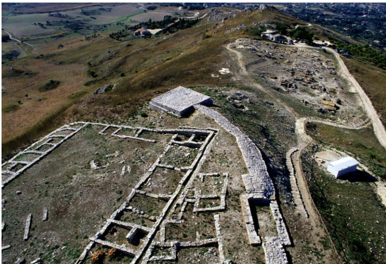
Fig. 2. Monte Adranone. La Porta Sud, il propugnacolo e il santuario.

interrotta da porte fiancheggiate da torri, si svolge seguendo la conformazione del terreno lungo i versanti ovest e nord della collina su cui sorge l'insediamento, mentre si interrompe sul lato est, dove si sviluppa uno strapiombo roccioso. L'ingresso principale alla città doveva essere quello di sud-ovest, da cui si giungeva anche alla necropoli. Nel IV secolo si registrerebbe un rafforzamento della cinta muraria in più punti, mentre l'acropoli viene circondata da un apposito anello di mura, con relativa porta, collegato alla cinta principale con muri trasversali. Successivo ancora, il robusto propugnacolo avanzato che si diparte dal torrione orientale della Porta Sud, accanto alla necropoli (fig. 2). Quanto alle aree sacre, gli scopritori hanno interpretato gli edifici rettangolari