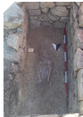
Fig. 8. Monte Adranone. Necropoli. Tomba 1/14.