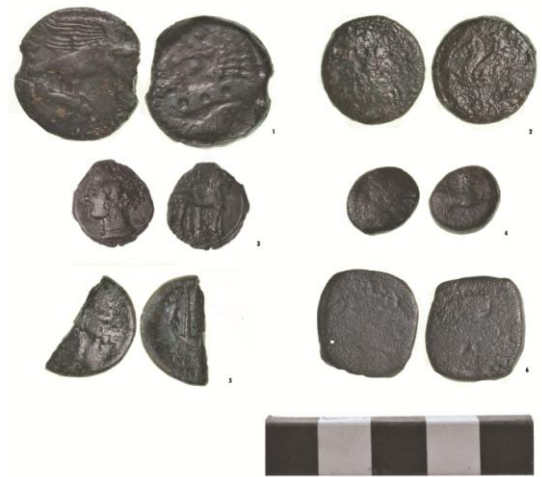
Fig. 27. Monte Adranone. Necropoli. Monete dallo scavo 2014.