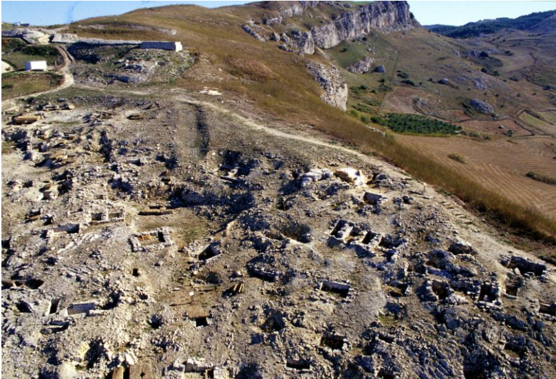
Fig. 3. Monte Adranone. La necropoli.