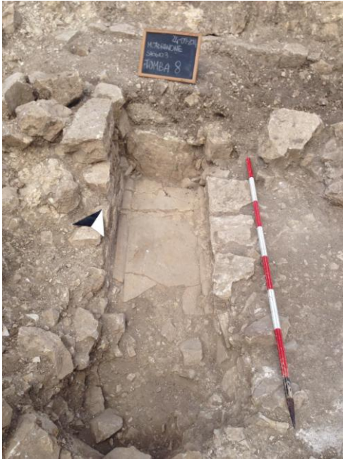
Fig. 15. Monte Adranone. Necropoli. Tomba 8/14.