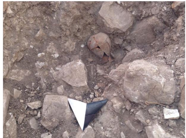
Fig. 22. Monte Adranone. Necropoli. All'esterno della Tomba 8/14, olpe acroma.