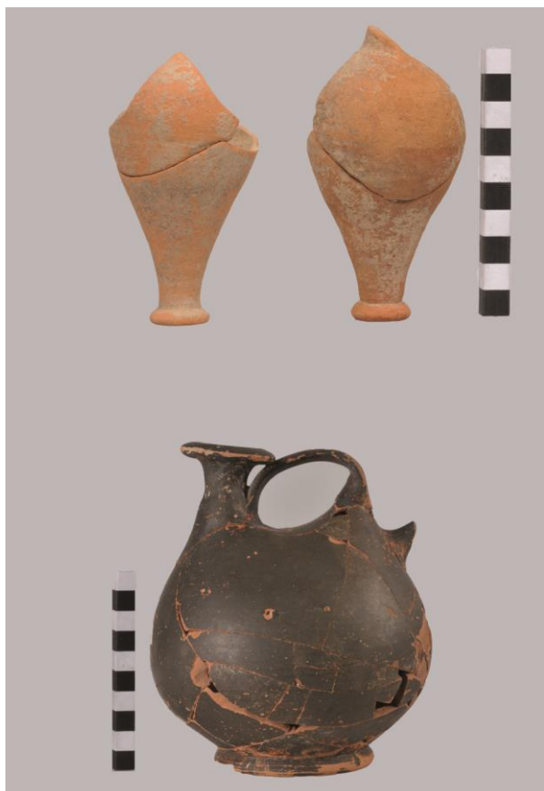
Fig. 24. Monte Adranone. Necropoli. Unguentari dalla Tomba 4/14 e askos a vernice nera dalla Tomba 6/14.