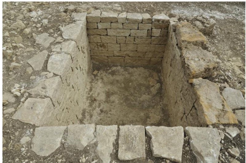
Fig. 18. Monte Adranone. Necropoli. Tomba 7/14.

contatto con il piano della Tomba 9. Il defunto sarebbe stato deposto su una lastra di terracotta, conservata solo in parte, con listello laterale, parzialmente rivestito dallo stesso intonaco presente sulle pareti della tomba. La base risulta gravemente danneggiata, in particolare al margine sud dove, peraltro, si perdono i limiti della struttura muraria e si evidenzia un consistente strato di crollo.