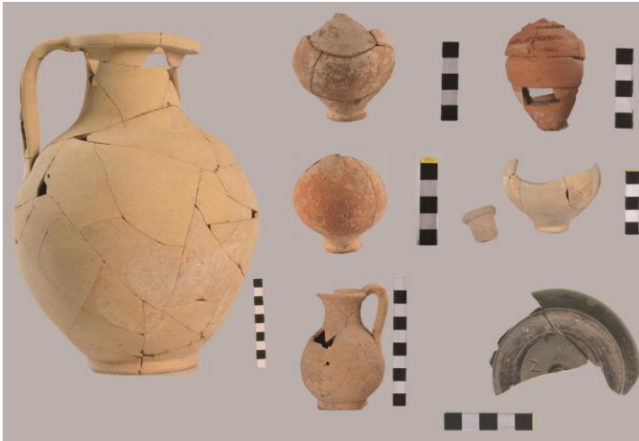
Fig. 26. Monte Adranone. Necropoli. Reperti dalla Tomba 9/14.