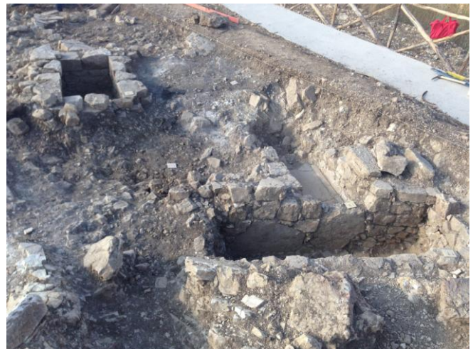
Fig. 20. Monte Adranone. Necropoli. Tombe 9/14, 8/14, 10/14.

Gli astragali, attestati nel 100% delle sepolture, potrebbero indicare, lì dove rinvenuti in numero maggiore ad uno, la presenza di più defunti nella stessa tomba, documentando lo sfruttamento intensivo della necropoli. Poco attestati a Lilibeo, più frequenti ad Entella, dove ne sono stati rinvenuti quattordici all'interno di una inumazione di IV/III secolo a.C. È possibile che le Tombe 3, 8, 9 siano state riutilizzate. La Tomba 3, ad esempio, presenta un probabile rifacimento della sua struttura esterna. Anche il materiale raccolto, che abbraccia un arco cronologico che va dall'inizio del V fino alla fine del IV secolo a.C., porterebbe a confermare tale ipotesi interpretativa. La Tomba 7, poi, potrebbe identificarsi con una camera ipogeica per deposizioni multiple, caratterizzata da una fattura più accurata nella giustapposizione dei blocchi di marna su tutti i suoi lati, ma dall'assenza del pozzetto di accesso che caratterizza altresì tali tipologie tombali.