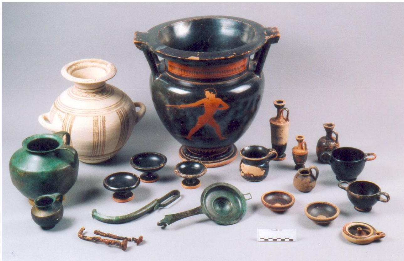
Fig. 29. Museo Archeologico di Palazzo Panitteri di Sambuca di Sicilia. Corredo della Tomba CIV di Monte Adranone (da TROMBI 2015).