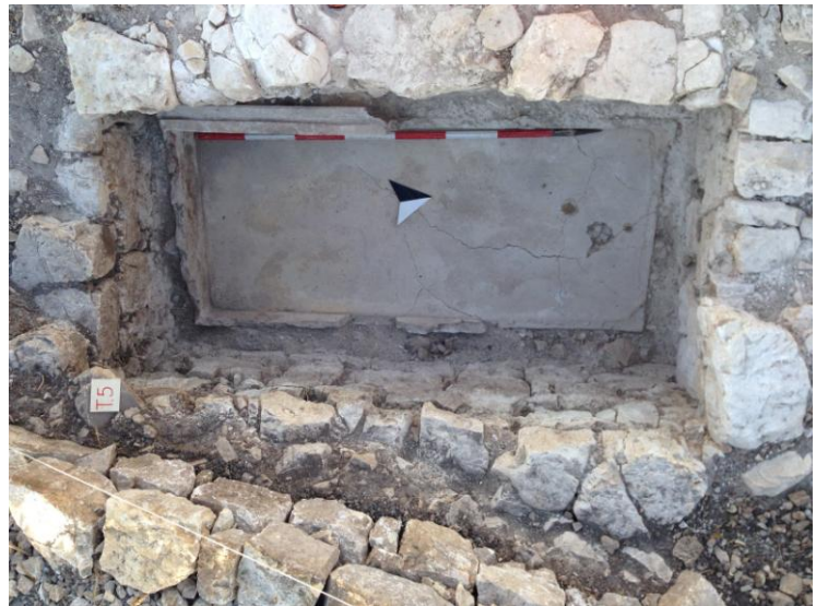
Fig. 12. Monte Adranone. Necropoli. Tomba 5/14.