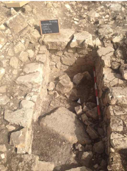
Fig. 14. Monte Adranone. Necropoli. Tomba 4/14.

Tomba 1. La struttura della tomba si presenta stretta e lunga (m 1,92 x 0,60) e, come le tombe adiacenti, collocata in senso N-S. Rimosso lo strato di riempimento con molte pietre di crollo, si rinvennero frammenti ricomponibili di vasi di piccole dimensioni e ossa concentrati per lo più nella parte settentrionale. Al limite orientale dell'area di scavo viene identificata la Tomba 5, che si presentava ricoperta da pietrame e terra, nonché da lastroni frammentari sparsi su tutta l'area. La rimozione del riempimento ha rivelato la presenza di un fitto strato di crollo formato per lo più da tegole e lastre in terracotta e tufo che costituiscono la parte restante del sistema di copertura del sarcofago fittile rinvenuto solo inferiormente all'interno della tomba 2 (figg. 12-13). Tra il crollo e il piano di deposizione, si individua un ulteriore strato di terra fine e morbida, biancastra che si estende su tutta la superficie della tomba, nel quale si rinvennero nove astragali collocati tra la parete della tomba e la cassa fittile.