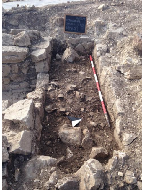
Fig. 16. Monte Adranone. Necropoli. Tomba 9/14.