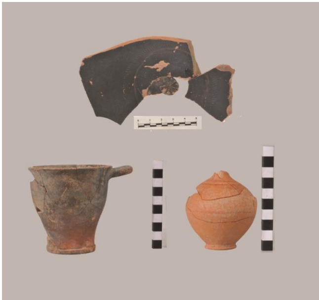
Fig. 23. Monte Adranone. Scavo 2014. Dallo strato superficiale.

Le stesse tipologie dei reperti ricorrono nei contesti funerari databili tra IV e III secolo a.C. e, in particolare, nelle necropoli della Sicilia occidentale. Siamo in quell'area di influenza punica, ricordata come eparchia cartaginese dalle fonti storiche 11 , che presenta analogie nella cultura materiale con l'Africa settentrionale, la Spagna meridionale e la Sardegna 12 . Così, nell'ambito della ceramica a vernice nera, lo skyphos attestato in Sicilia nelle necropoli di Palermo, Assoro, Lipari, e ad Agrigento e in Africa a Kerkouane nella prima metà del III secolo a.C. 13 e la coppetta Morel 2714, che richiama prototipi attici, diffusissima in area sia greca che punica tra IV e III secolo a.C. 14 (Tomba 8; figg. 23, 25). Allo stesso orizzonte cronologico appartengono altre due patere, di cui una presenta una N graffita sul fondo, un askos e un' oinochoe frammentaria 15 (Tombe 6, 8, 9; figg. 24, 25, 26). Gli oggetti più rappresentati sono gli unguentari di forma globulare e fusiforme (Tombe 4,8,9; figg.23, 24, 26), ampiamente documentati nelle necropoli di IV-III secolo a.C. 16 . In ceramica comune,