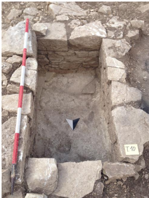
Fig. 17. Monte Adranone. Necropoli. Tomba 10/14.