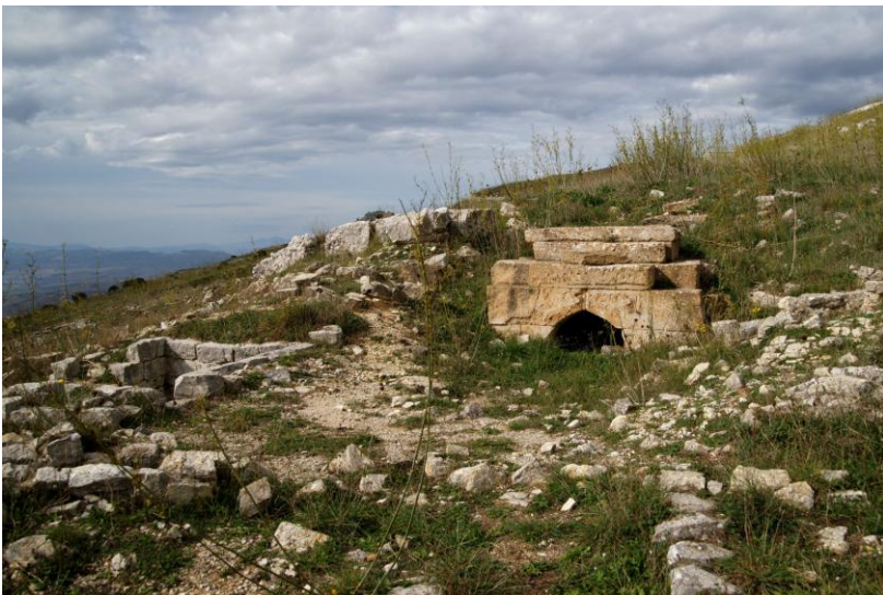
Fig. 4 a-b. Monte Adranone. La Tomba della Regina.