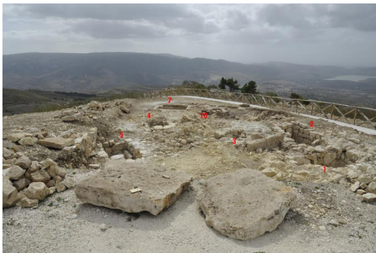
Fig. 7. Monte Adranone. Veduta generale dello scavo del 2014.

A sud-ovest viene individuata la Tomba 2, al cui interno era scivolata in parte la copertura formata da almeno quattro lastroni calcarenitici posti parallelamente nel senso della lunghezza e piccoli blocchetti laterali (fig. 9). La tomba si sviluppa in direzione N-S, è formata da blocchi marnosi sovrapposti e legati da una sottile malta di argilla mista a marna polverizzata e si presenta ben conservata nelle pareti nord, sud ed ovest 6 . Il muro est, invece, appare solo nei due filari inferiori, interrotti da una lacuna che funge da collegamento (funzionale?) con la sepoltura