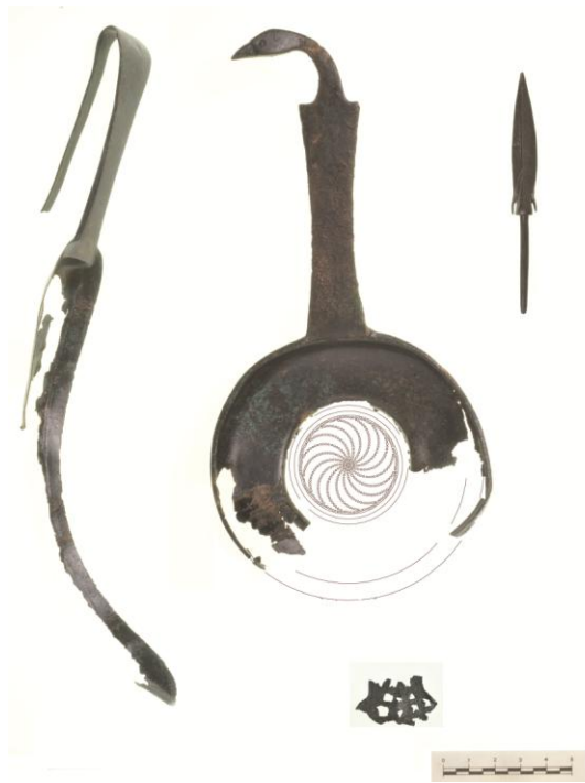
Fig. 28. Monte Adranone. Necropoli. Reperti in bronzo dallo scavo 2014.

I reperti esposti nel museo pertinenti alle tombe del IV-III secolo a.C., sebbene meno ricche rispetto alle sepolture più antiche, documentano ancora una comunità vivace e aperta a molteplici contatti. Oltre ai medesimi materiali documentati nelle sepolture scoperte nel 2014, figurano le lucerne acrome, i bombylioi con decorazione a reticolo, le pissidi a vasca carenata e le anfore a vernice nera con decorazione sovradipinta 24 . Inoltre, vasi di produzione italiota e siceliota, in particolare skyphoi , lekythoi e lekanides , forme connesse all'ambito muliebre ed in particolare ai riti nuziali, dato quest'ultimo assai significativo in relazione al contesto di rinvenimento, attestano una rete di scambi, feconda per i processi di assimilazione culturale e la trasmissione dei saperi artigianali (figg. 30-31). È il caso del Pittore di NYN, riconosciuto a Monte Adranone da Monica De Cesare, che, intorno al terzo quarto del IV secolo, dalla Campania si sarebbe spostato a Lipari, snodo culturale importante, collegato con i poli mercantili della Sicilia punica, che favoriscono la diffusione dei prodotti anche nei centri dell'entroterra, dove anche la presenza di mercenari campani deve avere giocato un ruolo decisivo nella diffusione di queste ceramiche 25 . Le stesse dinamiche potrebbero essere all'origine della circolazione delle lekythoi Pagenstecher, frequentemente attestate nei corredi tombali di Monte Adranone, boccette nate per il commercio