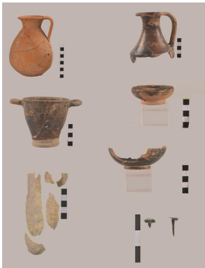
Fig. 25. Monte Adranone. Necropoli. Reperti dalla Tomba 8/14.

425/420 a.C. 18 (fig. 27,1). Ad età dionigiana può essere attribuita la moneta con ippocampo al rovescio, appena leggibile 19 (fig. 27,2). Al IV-III secolo si datano due monete bronzee tipiche della monetazione punica nella Sicilia occidentale 20 con testa di Tanit a sinistra, al dritto, e, al rovescio, cavallo a destra e dietro una palma da datteri in una, e cavallino libero in corsa, nell'altra 21 (fig. 27,3-4). All'età di Ierone II risale la litra frammentaria con testa di Poseidon al dritto e tridente tra due delfini al rovescio (fig. 27,5).