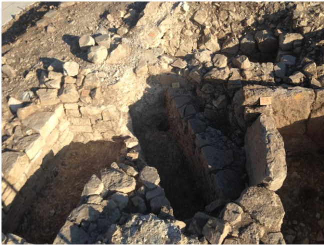
Fig. 19. Monte Adranone. Necropoli. Tombe 2/14, 6/14, 3/14.