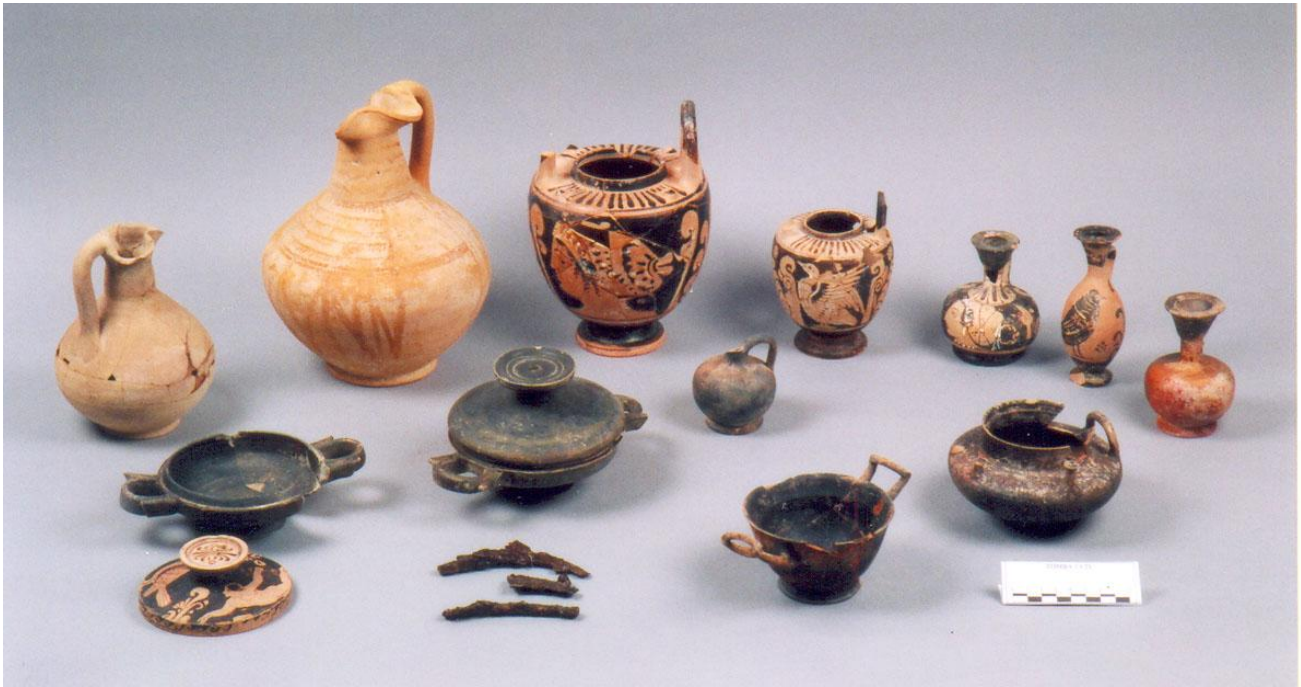
Fig. 31. Museo Archeologico di Palazzo Panitteri di Sambuca di Sicilia. Corredo della Tomba CCIV di Monte Adranone (da TROMBI 2015).