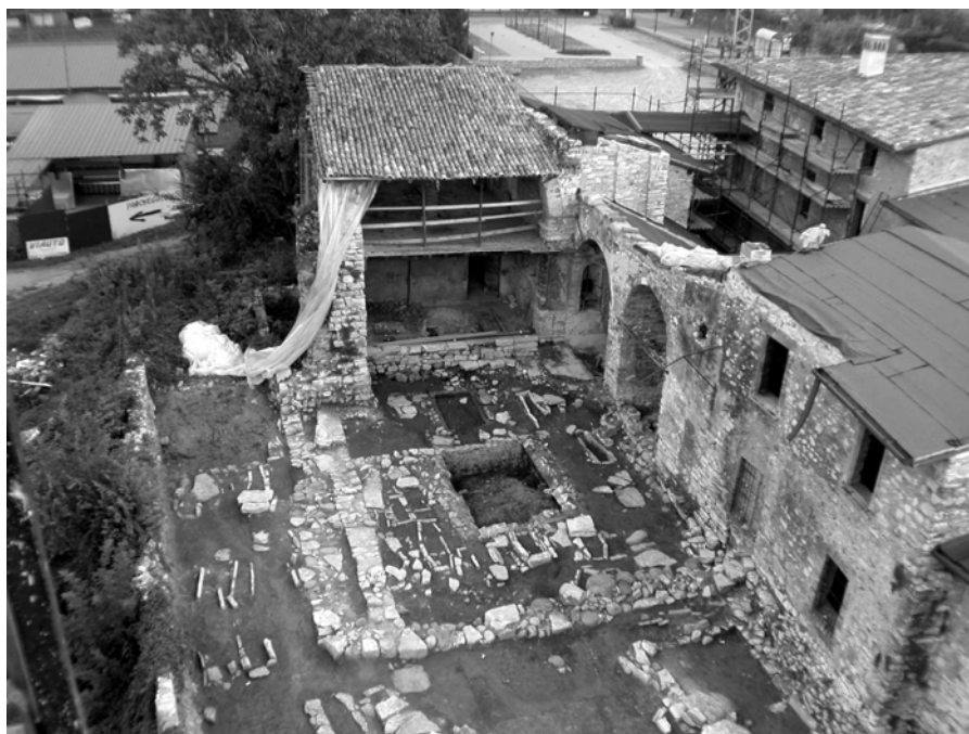
Fig. 1. Corte Franca. Veduta generale dello scavo.

Nel corso del 2005 è stato completato lo scavo del complesso dell'antica parrocchiale di Borgonato, già esplorato nel 2001 con sondaggi preliminari che avevano rilevato la presenza di almeno tre fasi dell'edificio di culto: un oratorio altomedievale (se non tardoantico) con sepolture in cassa litica e "alla cappuccina", la chiesa romanica a navata unica, con relative sepolture pure in cassa litica, affiancata da un robusto campanile e la ricostruzione quattrocentesca 1 (fig. 1). Le nuove indagini hanno interessato, per complessivi mq 1200, sia l'area a corte a ovest e sud-ovest della chiesa di S. Vitale, che quella a meridione, occupata da corpi edilizi stratificatisi tra il basso-medioevo e il XVII secolo; è stato quindi scavato pressoché totalmente il deposito archeologico dell'area, fatta salva la zona presbiteriale della chiesa rinascimentale che sarà oggetto di un'ulteriore campagna.