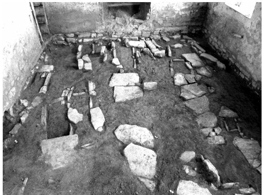
Fig. 3. Corte Franca. Dettaglio delle sepolture.

Chiari rapporti stratigrafici hanno consentito di accertare che le sepolture di quest'area appartenevano alla fase alto-medievale del cimitero, in quanto evidentemente anteriori alla canonica romanica, il cui