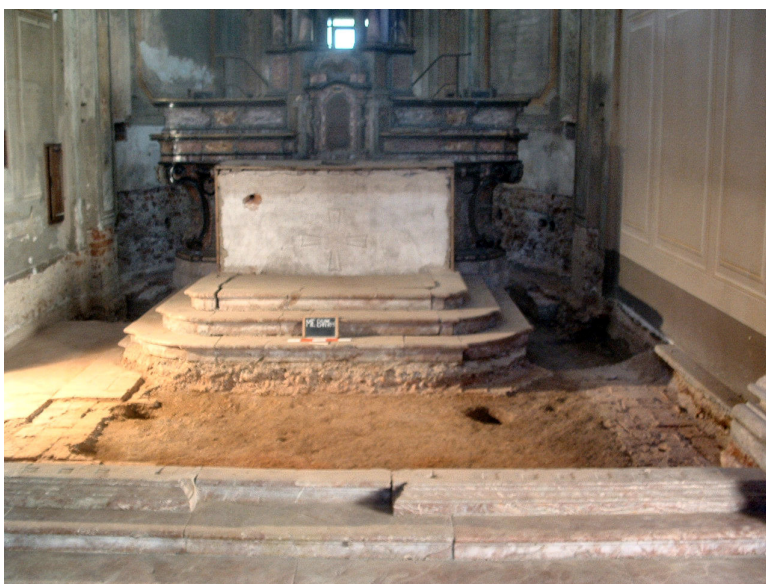
Fig. 2. L'area dell'attuale presbiterio, in fase di scavo.