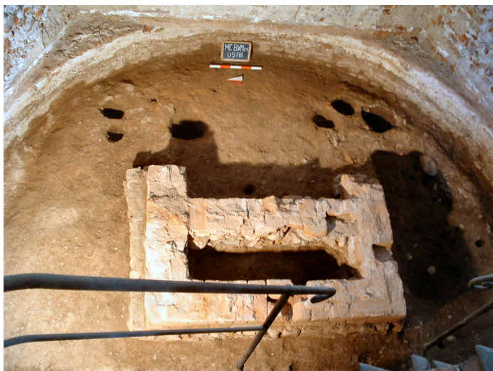
Fig. 3. L'area absidale con le fondazioni dell'altare della fase 2.