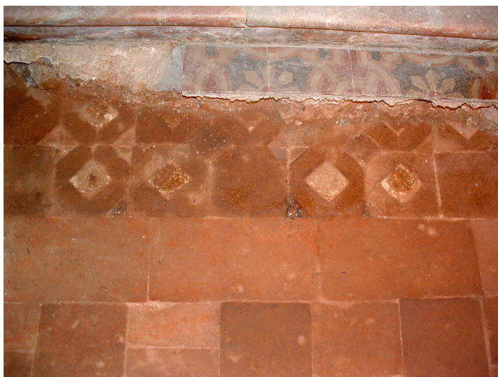
Fig. 4. Pavimento in cotto della fase 2.