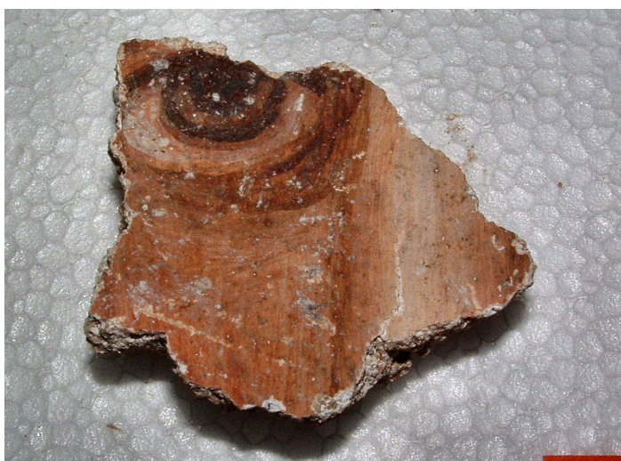
Fig. 5. Frammento di affresco con parti di occhio e naso di figura umana.

ovest, m 5, larghezza, da nord a sud, m 2,70. Nessun reperto ci indica l'età di questo primo impianto.