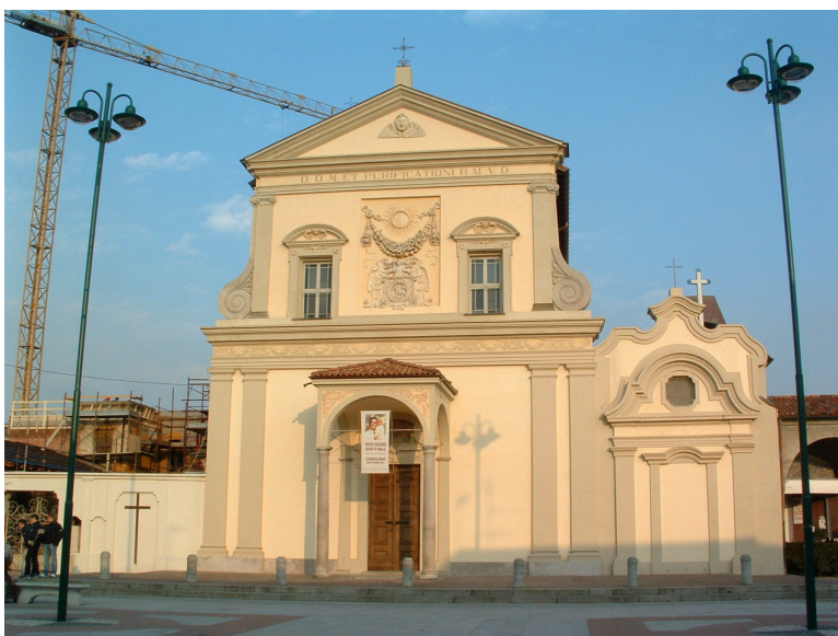
Fig. 1. L'attuale facciata della chiesa.

La fase più antica riconosciuta è rappresentata da due strutture murarie in ciottoli e malta, in fase con un piano pavimentale costruito con ghiaia e malta e con la superficie livellata da un impasto di colore rosato. Di questo primo impianto sono stati individuati il muro di chiusura est e un tratto del muro di chiusura sud, la cui porzione non indagata si trova sotto il massiccio altare sei-settecentesco. Non si conosce il limite a nord perché tagliato da strutture di impianto successivo: non si esclude che possa coincidere con il perimetrale nord dell'edificio della terza fase. Ad ovest non è stato individuato nessun limite di chiusura, ma nell'area della navata, esplorata con saggi, si sono chiaramente notate tracce di grandi bonifiche di cripte sepolcrali (lavori datati 1706) ed è probabile che la fondazione, già rasata in antico, non sia sopravvissuta a tali scavi. Le misure massime documentate sono: lunghezza, da est a