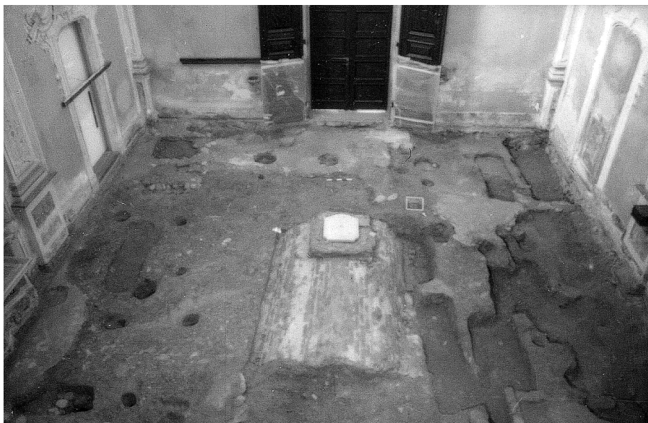
Fig. 4. Veduta generale dello scavo, al centro la volta della cripta centrale.

anch'essa inglobante grossi ciottoli. Il raccordo fra questi due bracci avviene, ad ovest, tramite un rinforzo angolare o base di pilastro, delle dimensioni di m 1,20 x 0,90. Quest'ultimo, pur realizzato con materiali edilizi pressappoco identici a quelli già descritti, ha un legante leggermente diverso, di colore biancastro. Un ultimo braccio si sviluppa a NE del braccio N-S: è stato possibile documentarlo solo parzialmente poiché in parte coperto dalla balaustra di recinzione dell'altare. Esso misura m 0,50 in senso N-S e m 0,60 in senso E-W. Ad ovest risulta asportato dal taglio della tomba 1. La tecnica edilizia è identica a quella documentata negli altri bracci del muro. Verso sud, in corrispondenza dell'attuale ingresso della chiesa, è stato rinvenuto un piccolo lacerto conservato anch'esso a livello di fondazione, molto simile per tecnica edilizia a US 9 e in linea con il suo braccio N-S. È stato possibile misurarlo per m 0,60 N-S (ma continua sotto il muro perimetrale sud della chiesa) x m 0,94 in senso E-W.