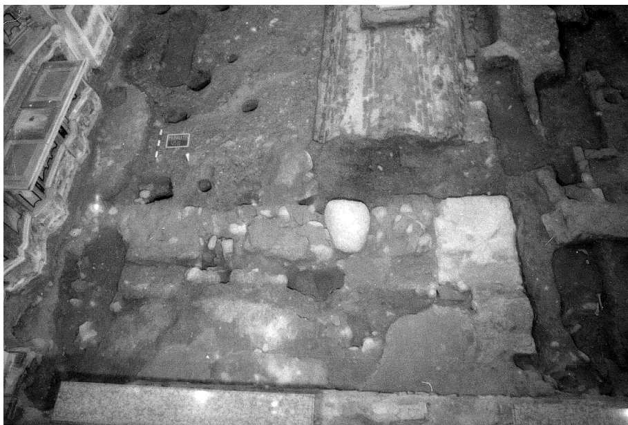
Fig. 2. Veduta generale: in primo piano le fondazioni attribuibili alla prima fase della chiesa e buche dei pali per le impalcature.

le ossa. Entrambi sono stati deposti con cranio a sud e probabilmente con il viso rivolto verso l'altare. L'inumato situato ad est si presenta disteso, con il bacino leggermente spostato, la gamba sinistra ripiegata verso la destra, distesa lungo la parete della cripta; la parte inferiore del corpo è coperta da lembi di tessuto nero, piuttosto spesso, che è stato lasciato in posto. Lo scheletro ad ovest, disteso, è stato deposto con il braccio destro ripiegato all'altezza del torace. La parte inferiore del corpo, a ridosso dell'altro inumato, presenta la gamba destra sovrapposta e ripiegata sulla sinistra. La posizione di alcune ossa della mano suggerisce che il braccio sinistro sia stato disteso lungo il fianco. Non si esclude la possibilità che i due inumati siano stati deposti in momenti differenti: lo scheletro ad ovest appare infatti "disturbato", forse